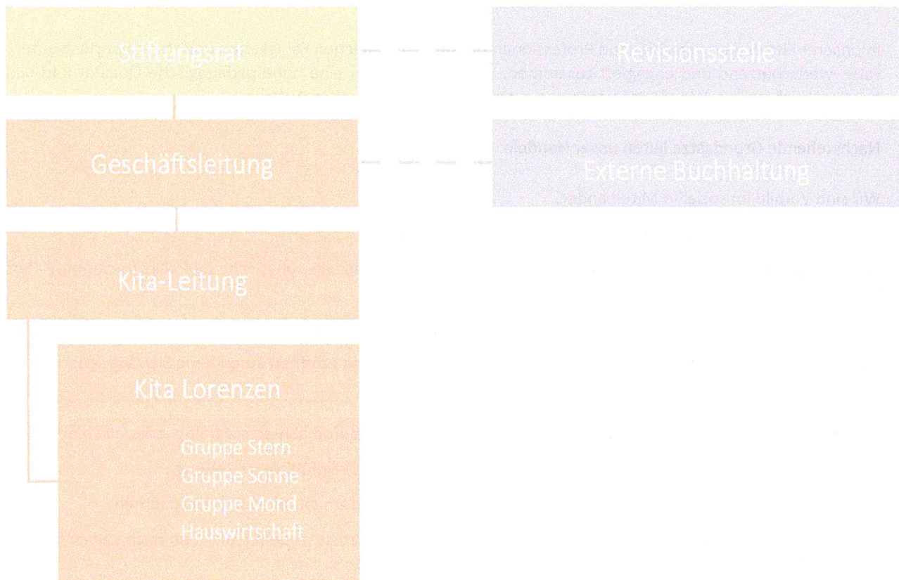
Organigramm gültig ab 01.08.2021. Grund: Statutenrevision, Veränderungen Kita-Strukturen.